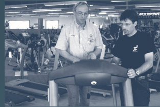
Produktvergleich vor Ort

In unseren Filialen mit europaweit mehr als 6700m 2 Ausstellungsfläche können Sie sich direkt vor Ort beraten lassen und das Gerät Ihrer Wahl ausprobieren und auf Herz und Nieren prüfen.